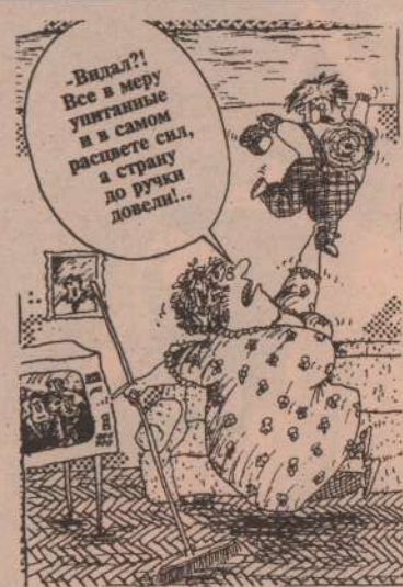
Рисунок В. Шилова.