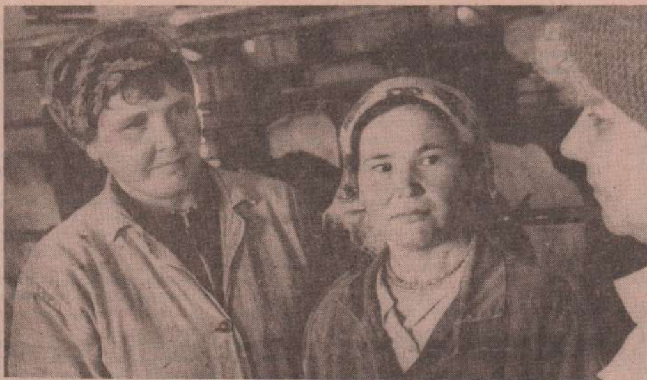
НА БОГАТЕНКОВСКОЙ ФЕРМЕ