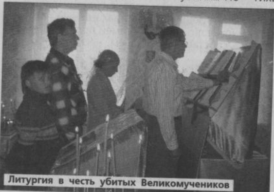
Литургия в честь убитых Великомучеников

Приход был открыт в 1750 году. Первый деревянный храм был заложен в 1751 году, а освящен в 1753-м. Это здание простояло 95 лет, пока его не продали в 1848 году в с. Волково. В Травянский приход входили деревни Большая Грязнуха (Карпушина), Монастырка, Луга (Костылева или Одина), Суворы. В 1832 году был заложен второй, уже каменный храм. Левый придел в честь Богоявления Господня освящен в 1837 году. Главный храм в честь Введения во храм Пресвятой Богородицы освящен в 1845-м. Правый придел во имя праведного Прокопия Устюжского освящен в 1848 году. Церковь закрыли в 1936 году. Современное состояние: полуразрушена. Священник Александр Иванович Попов причислен к Собору новомучеников и исповедников российских XX века Постановлением Святейшего Патриарха и Священного Синода Российской православной церкви от 17 июля 2002 года.