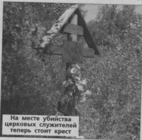
На месте убийства церковных служителей теперь стоит крест

Е.А. Бунькова, с. Травянское