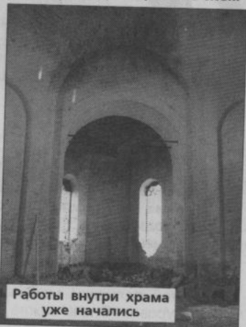
Работы внутри храма уже начались