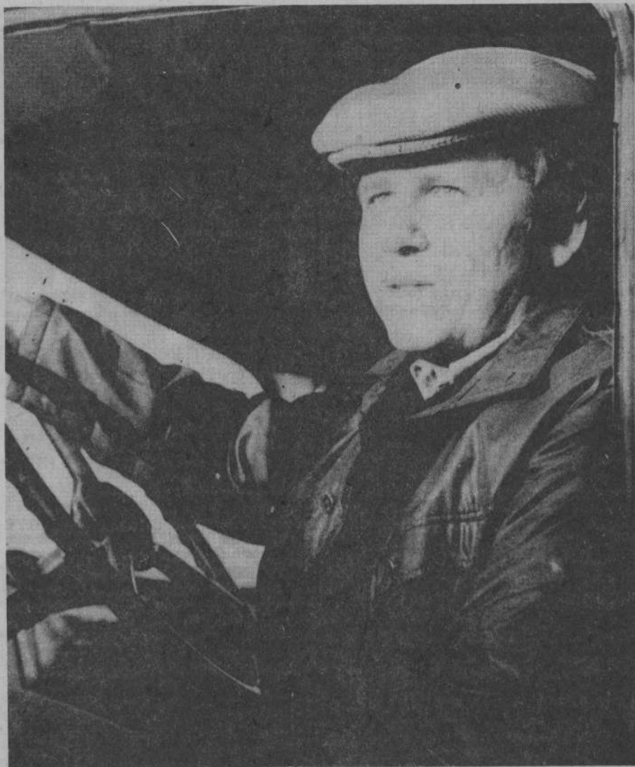
ЗАВТРА — ДЕНЬ РАБОТНИКОВ АВТОМОБИЛЬНОГО ТРАНСПОРТА