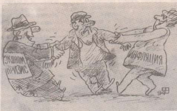
Рисунок В. Федорова.