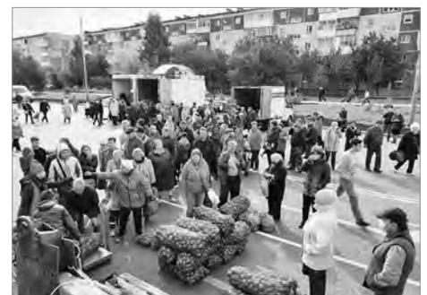
Осенняя ярмарка – 2020

Приоритетным направлением животноводства является производство молока, на долю которого приходится 76,6% от всего объема товарной животноводческой продукции. Молочное животноводство во всех организациях рентабельно: в 2019 г. уровень рентабельности молока