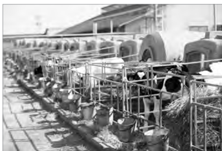
Холодный метод выращивания молодняка

С 2018 г. в АО «Каменское» применяется технология осеменения тёлочек сексированным, то есть разделённым по полу, семенем. Это позволяет получать до 85% тёлочек, что очень важно для воспроизводства стада. С 2015 г. используется аппарат УЗИ, который позволяет выявлять у коров раннюю стельность и различные гинекологические заболевания.