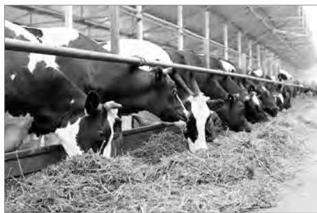
МТФ Позариха 3 АО «Каменское»

41% дойного стада находится на круглогодично-стойловом содержании, с кормлением монокормом – 80%. Системы доения коров: 59% – в молокопровод, 41% – в доильных залах «Европараллель», «Westfalia», «Dairymaster». На современных животноводческих фермах животные имеют специальные устройства, которые позволяют идентифицировать каждое животное, фиксировать удой, скорость молокоотдачи и его активность в течение определенного периода времени, что помогает отслеживать физиологическое состояние животного.