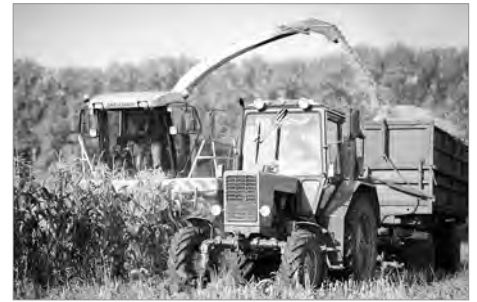
Уборка кукурузы в АО «Каменское»