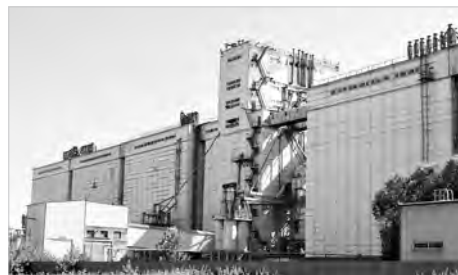
Хлебная база №65

Хочется отметить и поблагодарить предприятия, с которыми тесно сотрудничают каменские аграрии.