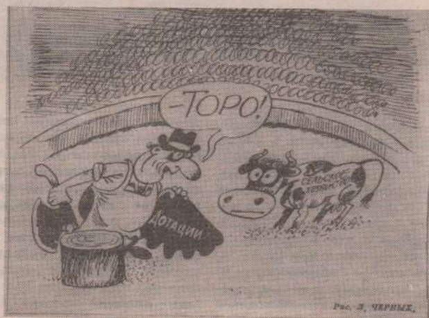
Рис. В. ЧЕРНЫХ.

Г. ГРИГОРЬЕВ, главный гос. инженер-инспектор Гостехнадзора района.