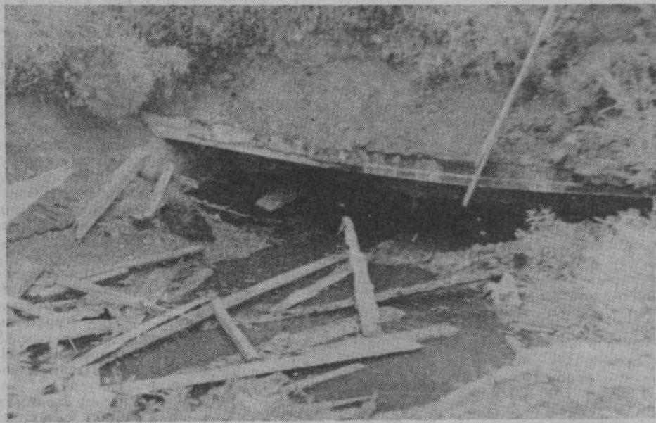
Вот так выглядит достопримечательная яма.