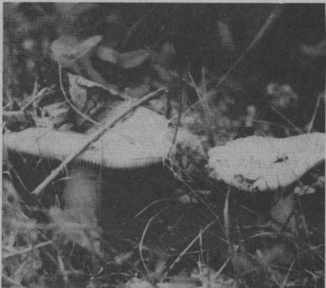
Щедра кладовая осени.

М. ЗАВЬЯЛОВА, внештатный корреспондент. с. Новоисетское.