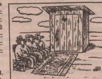
Рис. Владимира Милейко (С.-Петербург).