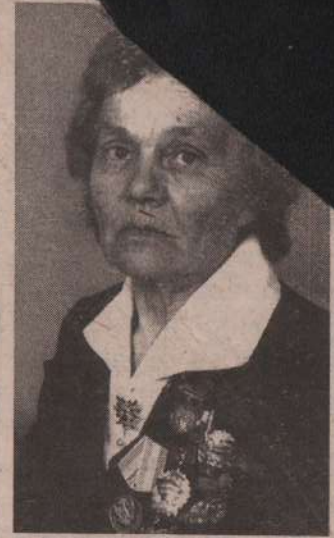
О ЛЮДЯХ ХОРОШИХ