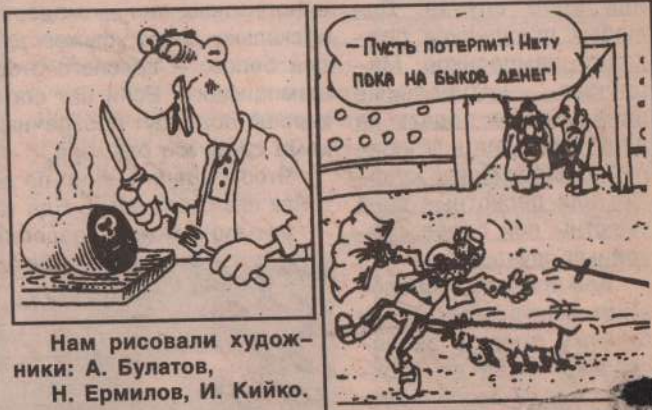
Нам рисовали художники: А. Булатов, Н. Ермилов, И. Кийко.