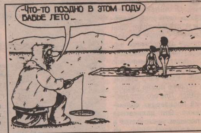
Рис. В. Федорова (Челябинск).