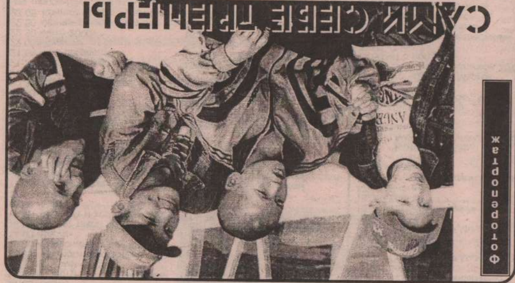
Фотопортрет жителей «Покровка»