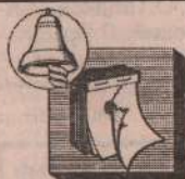
Редактор Т. Игнашова

По вертикали: 2. Изумруд. 3. Усмешка. 4. Бампер. 5. Орбита. 8. Театр. 10. Пермь. 13. Косушка. 15. Пакгауз. 16. "Ланча". 17. Страх. 18. "Огонь". 19. Жатва. 23. Тавро. 25. Любек. 26. Челнок. 28. Бакунин. 29. Агриппа. 30. Галлон.