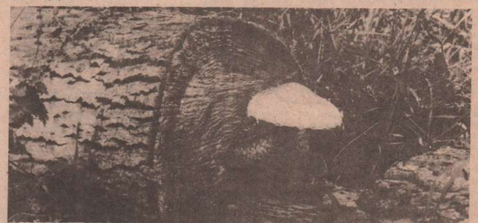
ОЧЕВИДНОЕ — НЕВЕРОЯТНОЕ