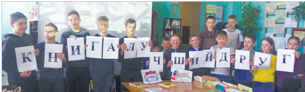
Ребята из Сипавского – активные читатели библиотеки