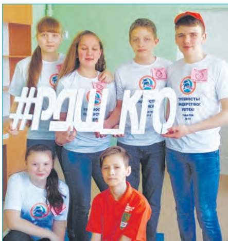
Команда знатоков из Каменского района