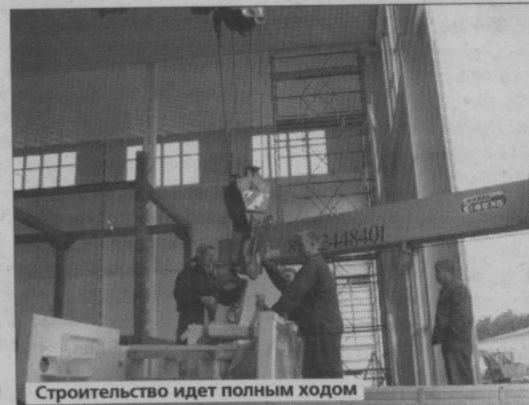
Строительство идет полным ходом