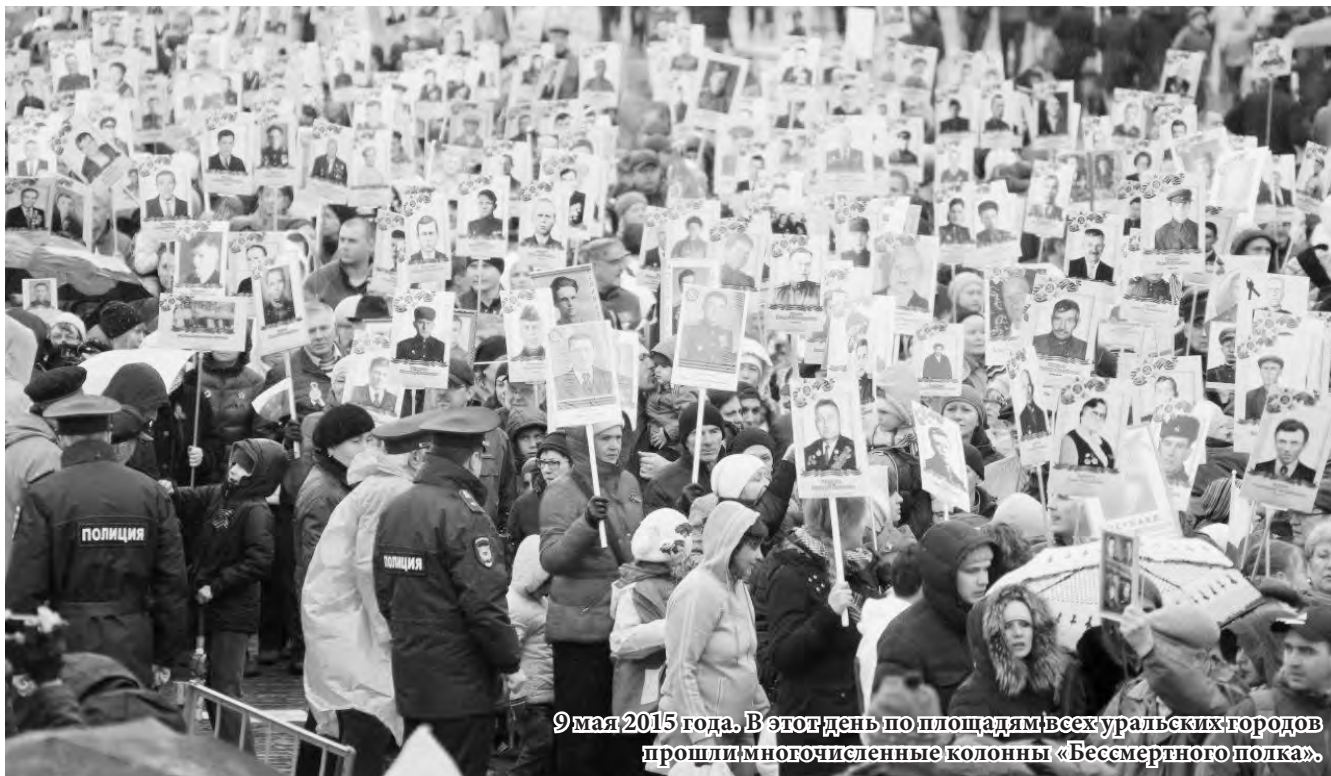
9 мая 2015 года. В этот день по площадям всех уральских городов прошли многочисленные колонны «Бессмертного полка».