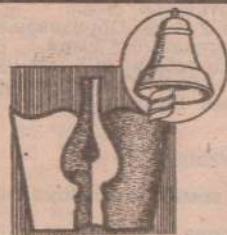
Редактор С. Трофимов

зательно растираться в воде мягкой губкой для улучшения кровообращения, а после ванны нанести на тело жидкий увлажняющий крем. Правда, делать это надо не от случая к случаю, а ежедневно.