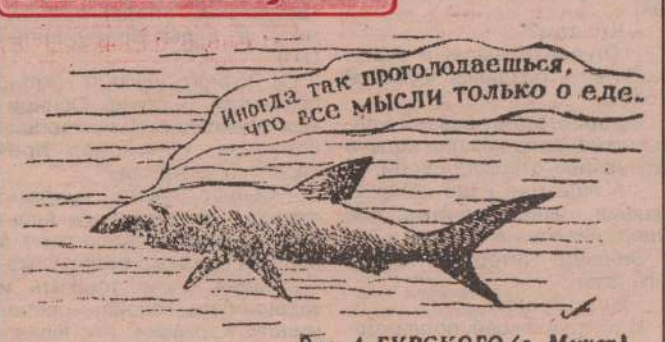
Рис. А.ГУРСКОГО (г. Минск).