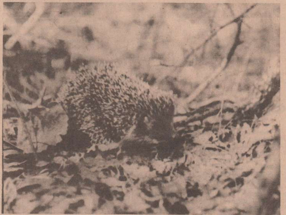
После зимней спячки.