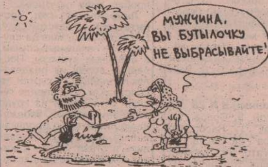
Рисунок В. Иванова.

На базаре г. Кукиш-на-Оке задержано лицо неопознанной национальности Г., обменивавшее нынешние российские деньги на якобы уже новые. Особенно хорошо шла купюра в 317 рублей с изображением конной статуи Г. Явлинского. И, что самое удивительное, фальшивые банкноты принимались в оплату на том же базаре: в частности, на одного "Григория" можно было купить контрольный пакет акций холдинговой компании "Кукиш-инвест". Ведется следствие.