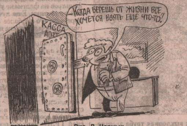
Рис. Л. Черных.

Полоса подготовлена по материалам российских и зарубежных СМИ.