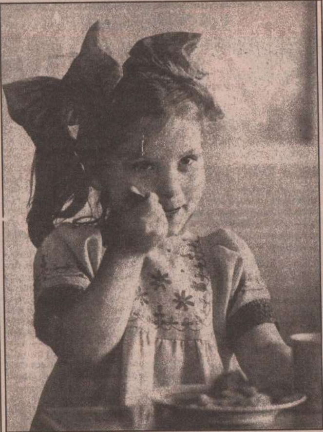
Ну очень вкусная каша!