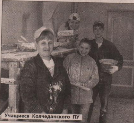
Учащиеся Колчеданского ПУ