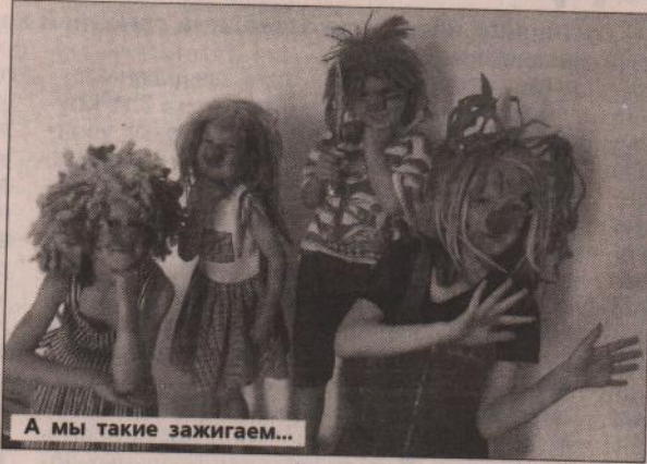
А мы такие зажигаем...

Но празднование на этом не закончилось. 2 июня все желающие могли посетить выставку рисунков «Безопасность нашей жизни», которая прошла в Бродовской администрации. 4 июня со-