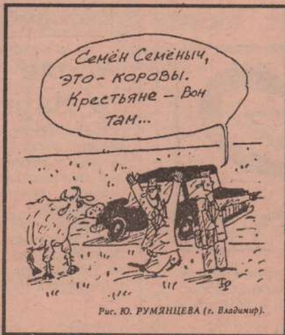
Рис. Ю. РУМЯНЦЕВА (г. Владимир).

Трудны лишь первые три дня. И еще совет: если утром у вас мало времени, пока жуеете салат, занимайтесь собой - подкрашивайтесь, одевайтесь.