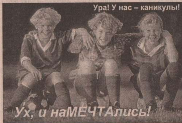
Ура! У нас – каникулы!