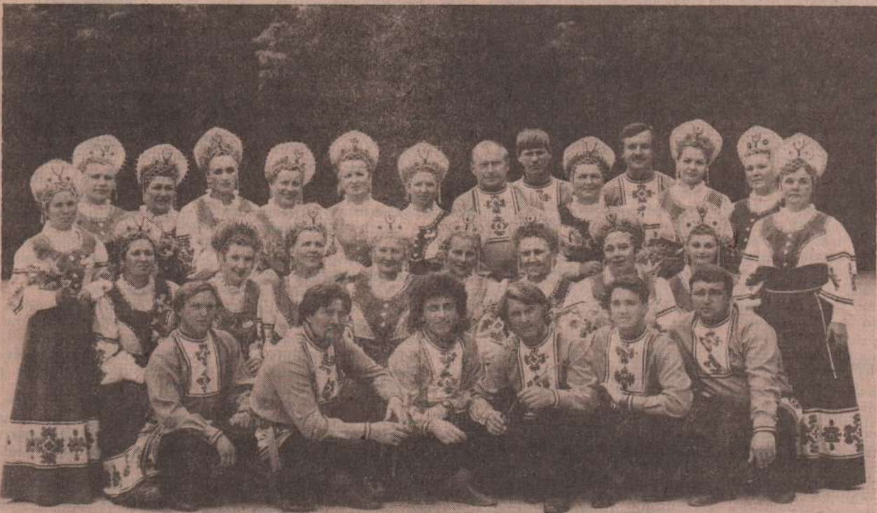
На снимке коллектив Сосновского народного хора. Нынче ему исполняется 30 лет. Материал читайте на 4-й странице.