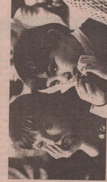
Тематическую "Семья" подготовила Т. ИГНАШОВА.