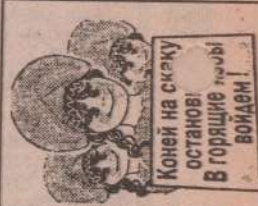
Колечко на скрепку останови! В горящие нитки войдем!

имеют семейных друзей, которые чувствуют себя обязанными организовывать для них встречи, добродушно принимая, так как они во всяком случае расширяют социальные горизонты.