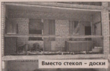
Вместо стекол - доски