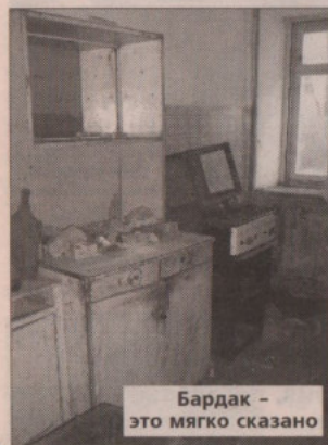
Бардак - это мягко сказано