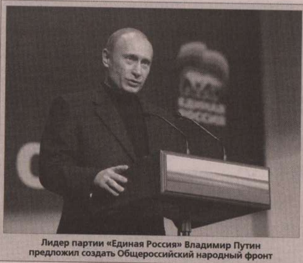
Лидер партии «Единая Россия» Владимир Путин предложил создать Общероссийский народный фронт

Эта стратегия абсолютно укладывается в новую политику «Единой России» — привлекать к обсуждению и решению важных вопросов как можно более широкие круги общественности. Подобная практика, к слову, у партии была и раньше — регулярные отчеты о деятельности единороссов можно прочитать во многих изданиях, в том числе и в нашем. По сути, «Единая Россия» сегодня является