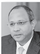
Панкаджем Сараном, посол Индии в Российской Федерации:

«Свердловская область рассчитывает на то, что партнёрство Индии в выставке ИННОПРОМ-2016 позволит индийским коллегам по достоинству оценить имеющийся промышленный и культурный потенциал Свердловской области, станет новым этапом в развитии деловых, культурных и дружественных связей».