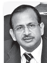
Рамеш Абхишек, заместитель министра торговли и промышленности Индии:

«В первую очередь, мы хотим представить народу России новые знания Индии в технической сфере. Мы хотим показать россиянам, что Индия меняется, что сегодня – это современная промышленная экономика».