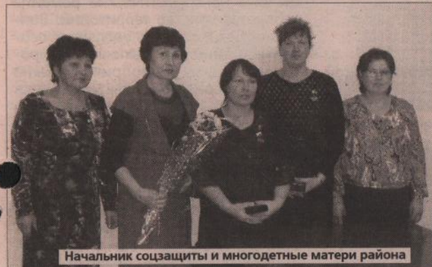
Начальник соцзащиты и многодетные матери района

Если дети – цветы жизни, то у этих женщин их – целые букеты. Четырем многодетным матерям нашего района 2 декабря в здании соцзащиты был вручен Знак отличия «Материнская доблесть» третьей степени.