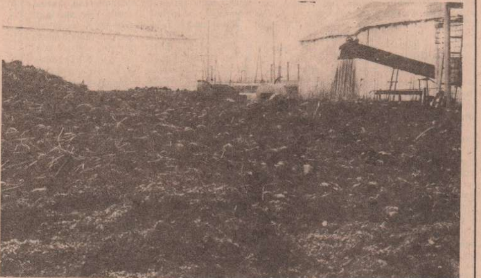
Это все, что осталось от урожая корнеплодов, собранного в Центральном отделении Каменского совхоза и успешно сгнившего нынешней весной. Рачительные хозяева, ничего не скажешь! Редакция надеется, что руководство совхоза сообщит о тех, кто понес наказание за подобное хозяйствование.