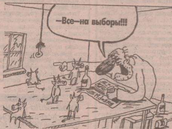
Рисунок В. ПЕСКОВА

Начальство делится на три категории: блестящее, растущее и эрудированное. Блестящее: те, у кого блестит лысина и одежда на коленях и локтях. Растущее: у кого растут живот и задница. Эрудированное: которое отличает Гоголя от Гегеля, Гегеля от Бебеля, Бебеля от Бабеля, Бабеля от кабеля, кабель от кобеля и кобеля от суки.