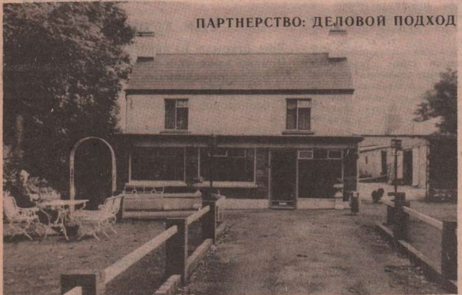
ПАРТНЕРСТВО: ДЕЛОВОЙ ПОДХОД