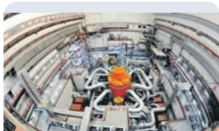
Пуск энергоблока № 4 реактора БН-800 на Белоярской АЭС Заречный