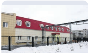
Центр семейной медицины с жилыми квартирами для персонала Кушва