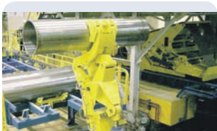
Пуск первой очереди прокатного комплекса Каменск-Уральский