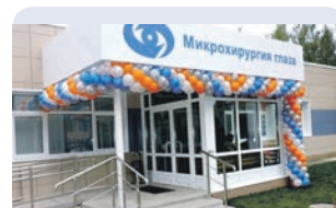
Открылся специализированный центр «Микрохирургия глаза» Кировград