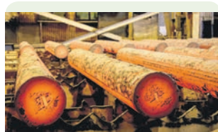
Новый прокатный стан на Северском трубном заводе Полевской