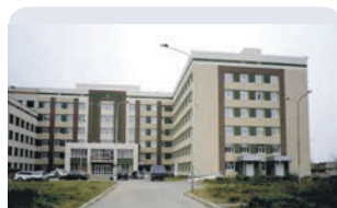
Лечебный корпус центральной городской больницы Североуральск