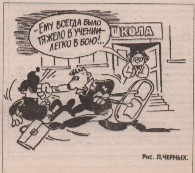
Рис. Л. ЧЕРНЫХ.