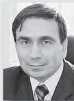
Николай Смирнов, и.о. министра энергетики и ЖКХ Свердловской области:

«Это огромные средства, которые муниципалитеты получили благодаря принципиальному решению губернатора об увеличении финансирования отрасли. Большая часть средств направляется на модернизацию коммунального комплекса. В последние два года работа в этом направлении позволяет региону организованно готовиться к зиме».