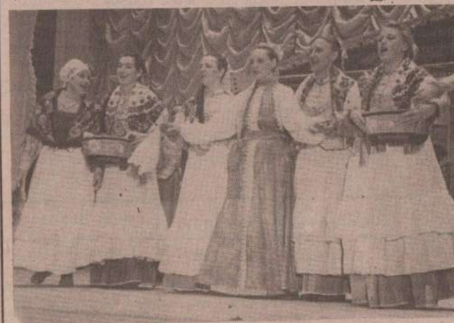
Во Дворец культуры Синарского трубного завода на праздник «Проводы зимы» приезжали самодеятельные артисты из с. Сосновского. А за неделю до этого ансамбль ДК СинТЗ побывал с концертами у сельчан.

На снимке: сосновские красавицы.