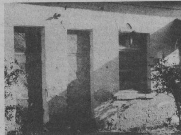
В таком заброшенном здании на территории центральной районной больницы уже год живет районный врач-педиатр.

3. Открыть лечебно-оздоровительный комплекс в подвальном помещении амбулатории пос. Мартюш. 1989 г. Ответственные — Мартюшевская МПМК, Бродовской совхоз.