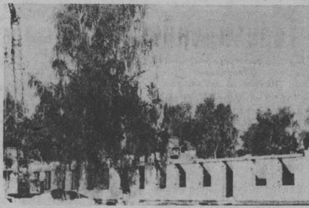
Строится родильный дом в центральной районной больнице.

4. Начать строительство типового фельдшерского пункта в с. Рыбниковском. 1990 г. Ответственный — совхоз «Родина».