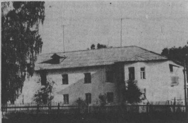
Дом для медиков в с. Покровском после капитального ремонта.