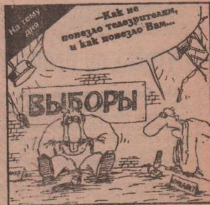
рис. В. Шилова (С. - Петербург)