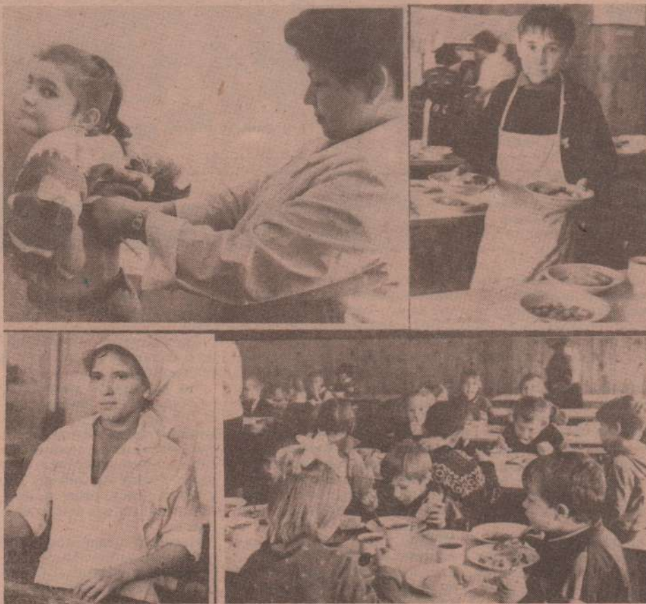
В с. Клевакинском дети считают свою школу вторым родным домом. Здесь они постигают азы науки, учатся дружить, в школьной столовой их вкусно накормят.