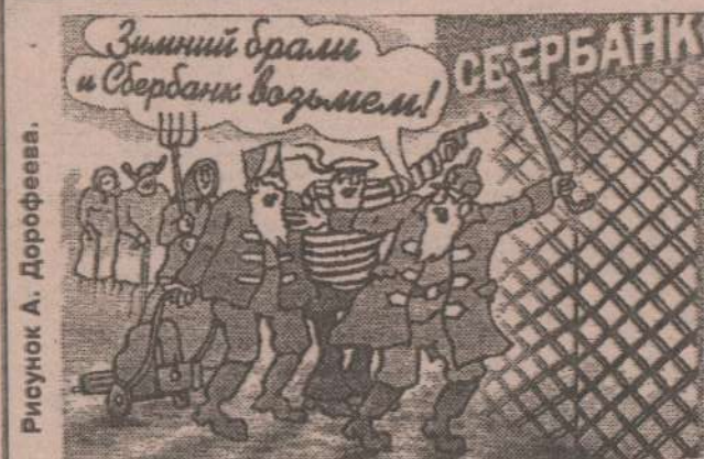
Рисунок А. Дорофеева.