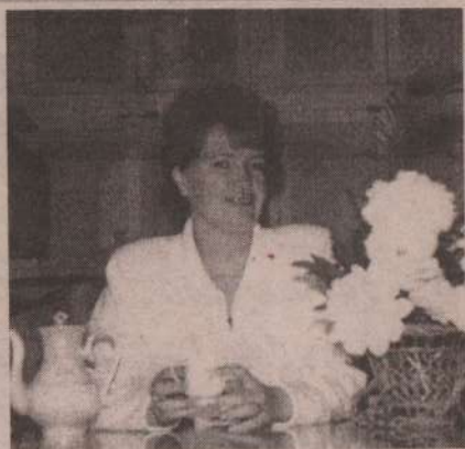
На фото автора: С. В. Лободи-на; добро пожаловать в магазин.