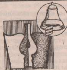
Редактор С. Трофимов

На самом деле тайна проста: девушка, поразительно похожая на знаменитую певицу, действительно существует и является ее родной сестрой. Сестренка-двойняшка, в отличие от Тани, живет на Украине и хоть петь так, как Таня, не умеет, зато хорошо готовит. Большой радостью для обеих Овсиенок являются встречи у мамы в Киеве. И несмотря на то, что сестры любят друг друга и по-родственному готовы сделать друг для друга чуть ли не все на свете, Таня сестру не афиширует - кто знает, может, и в самом деле понадобится двойник?