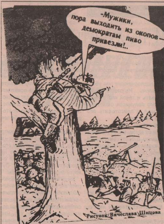
Рисунок Вячеслава Щиря