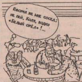
Рисунок А. Евтушенко.

Думается, понятно, что цену можно накручивать и выше, а вот опускаться - ну никак.