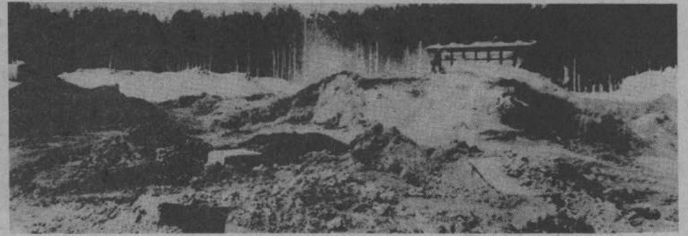
Так хранятся удобрения в «Агропромхимии».