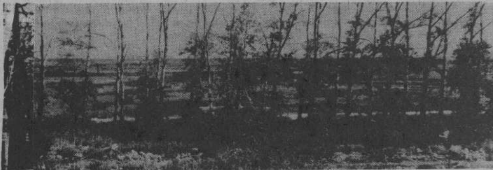
И деревья не растут...