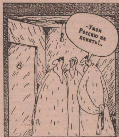
Рисунок В. Шиловой.