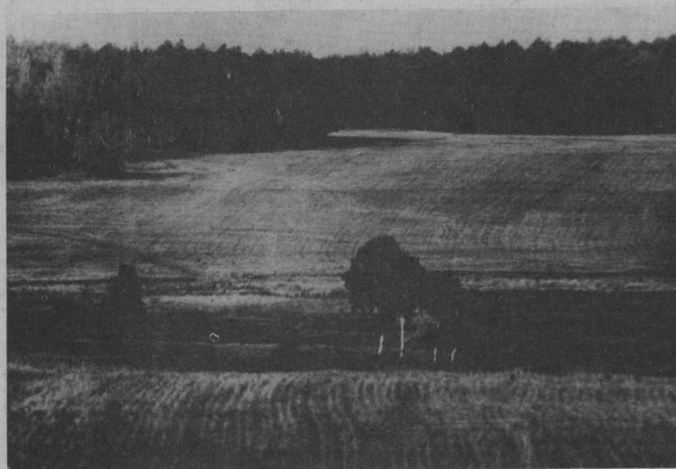
Опустели хлебные нивы...