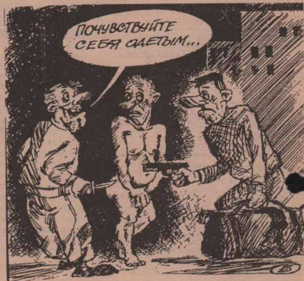
Рисунок Е. Беликова.