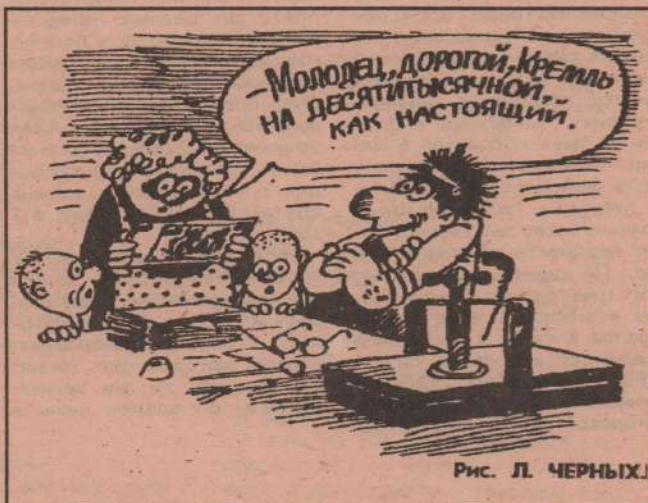
Рис. Л. ЧЕРНЫХ