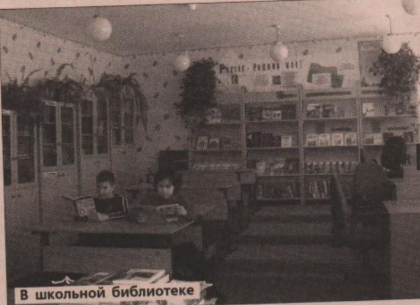
В школьной библиотеке

Все это не могло не сказаться на результатах деятельности школы. Третий год 1 сентября все дети школьного возраста садятся за парты, нет второгодников (кроме как по медицинским показаниям). Все выпускники 9 и 11 классов допускаются к государственной итоговой аттестации, успешно проходят ее и получают документ об образовании, до 99% выпускников 9 класса продолжают получать образование, до 60% выпускников 11 класса поступают в ВУЗы, три ученицы закончили школу с медалями.