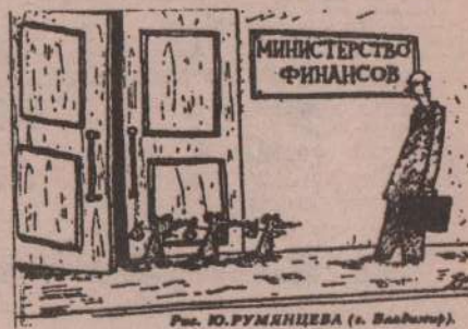
Рис. Ю.РУМЯНЦЕВА (в. Вадимов).

прибыль (план 1175 млн., факт - 703 млн.), плата за недра составила лишь 22% к плану (40 млн. и 9 млн. соответственно), налог на имущество - 60% (994 млн. и 595 млн.). На 1 июля недоимка по налогу на прибыль составляла 303 млн., налога на имущество - 334,9 млн., налога на содержание жилья и объектов соц. сферы - 320,5 млн. руб. Постановлением главы администрации района определен порядок проведения взаимозачетов по погашению недоимки платежей и задолженности предприятий за коммунальные услуги. Расходная часть бюджета освоена к уточненным назначениям на 74% (план - 26739 млн., факт - 19908 млн.). Средства на финансирование народного хозяйства освоены на 57%. По учреждениям народного хозяйства освоено 84%, по учреждениям здравоо-