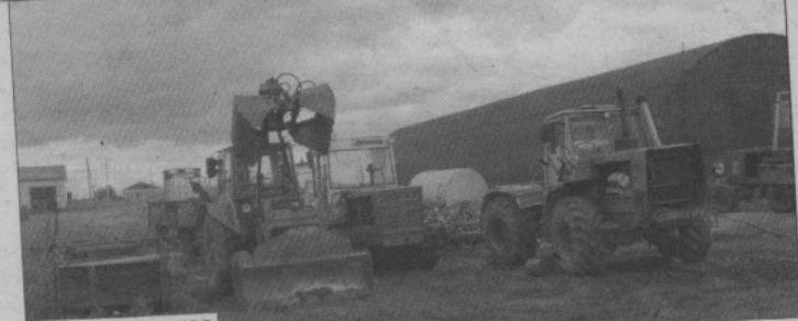
И техника новая

ло увеличение стоимости электроэнергии. Цена на электроэнергию выросла значительно: до 3,5 рублей, а было 2 рубля. А еще энергетики часто просят предоплату за следующий месяц - примерно половину.