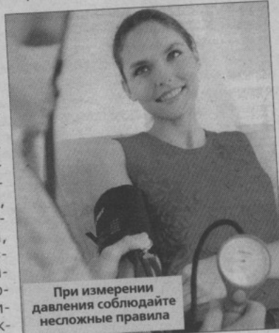
При измерении давления соблюдайте несложные правила

А еще лучше - положите ее на стол. Важен размер манжеты. Если плечо полное, она должна быть широкой. Каждый раз измеряйте АД дважды, желательно на обеих руках.