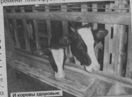
И коровы здоровые.

Это дало возможность работать нормально. Раньше не было техники для обработки почвы, только дисковая борона 25-летней давности, которая землю не обрабатывала, а портила. А сейчас с дискатором работать стало легче. Нынче трудные времена у всех, и вряд ли приходится уповать на помощь более сильных соседей. Напротив, мощный удар по предприятиям нанес-